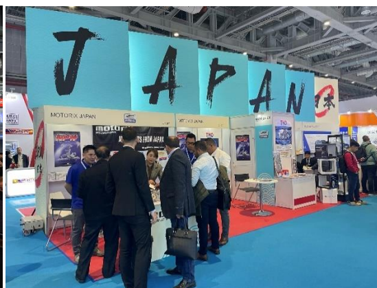
右:ジャパンパビリオンの様子(ホール 2.1)